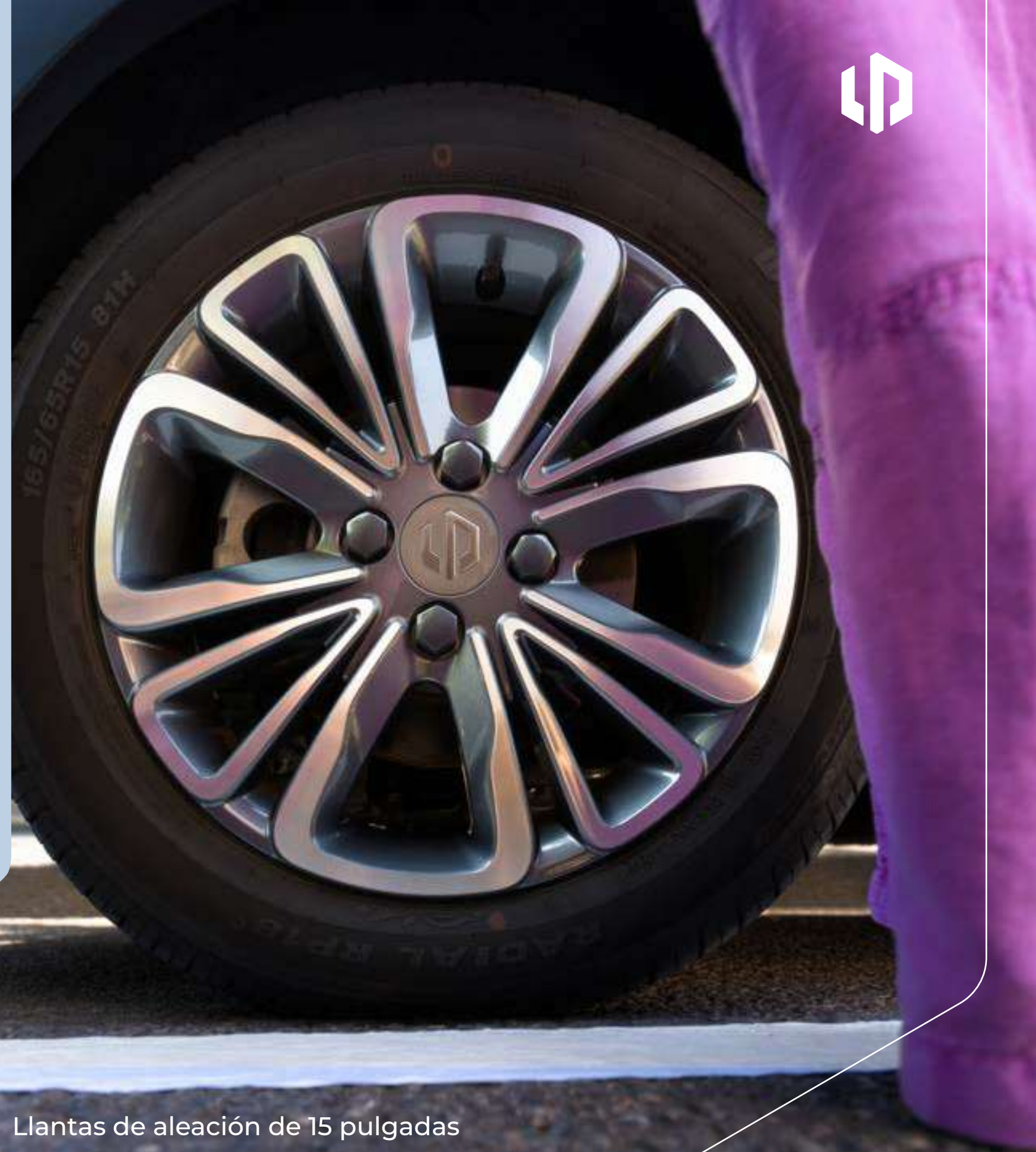
Llantas de aleación de 15 pulgadas