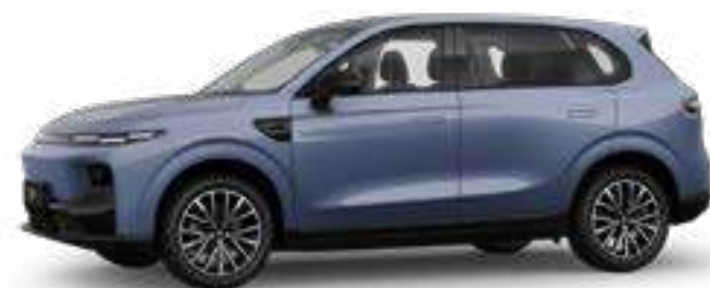
AZUL NOCHE ESTRELLADA