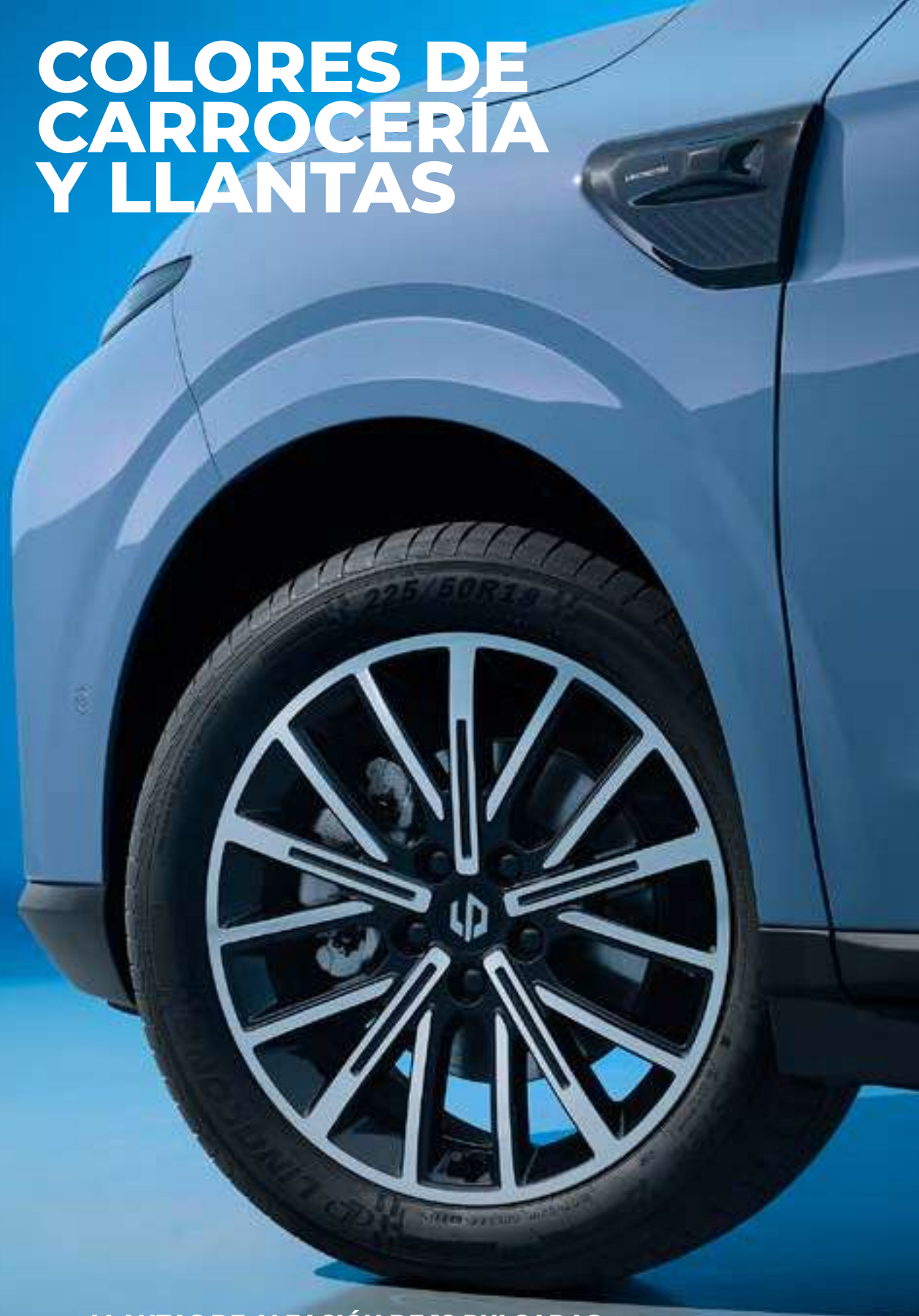
LLANTAS DE ALEACIÓN DE 18 PULGADAS